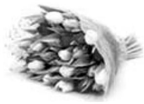
Дети, внуки, правнуки.

Дорогая, милая, родная, В этот день, твой юбилей, Много разных пожеланий Прими от внуков и детей. Все было в жизни – радости и беды, И сладкий мед, и горькая полынь, И прожито, и сделано немало И мы тебя за все благодарим.